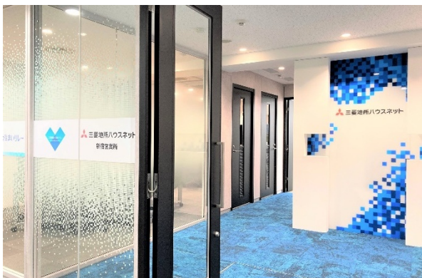
▲新宿営業所：エントランス