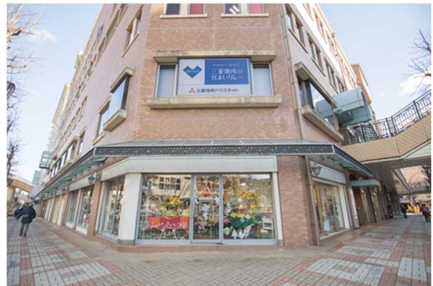
▲ラポルテ本館 2 階 新たに誕生した『芦屋サロン』外観