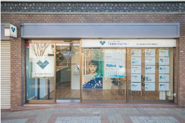
▲ラポルテ西館 1 階 山手幹線沿いの『芦屋営業所』