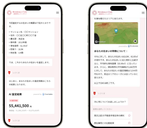
◀本サービスの画面イメージ (左：査定結果ページ、 右：査定結果サマリーページ)

本サービスでは、生成 AI に様々な内容を学習させることで、査定金額を提示するだけでなく、その他お客様に役立つ情報を提供するなど、まるで営業担当者と話しているかのような双方向コミュニケーションを実現するべく、ベータ版を開発しました。将来的にはサービスの機能拡充や、「三菱地所のレジデンスクラブ」非会員も含めたサービス利用対象者の拡大も検討予定です。