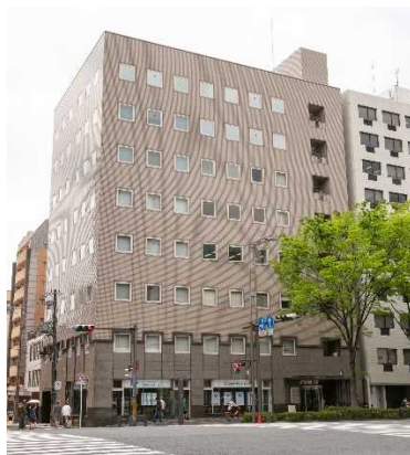
▲『京都営業所』のある京ビル2号館