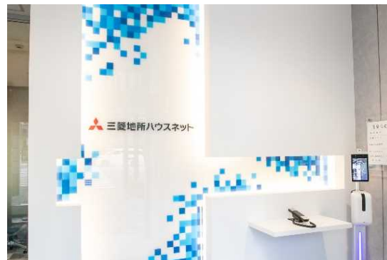
▲エントランス・受付