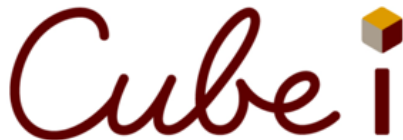
Cube i ロゴマーク

「新しい時代に新しい住まい選びのカタチを」をスローガンに従来の顧客と業者との関係ではなく、信頼できる「頼れるパートナー」として、3つの「i」を立体的に組み合わせながら、大切な方の大切な道を共に歩んでいきたい、という思いで作りました。