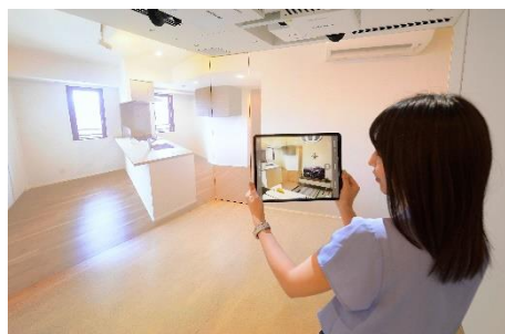
ホワイトキューブ内でのヴァーチャル内覧