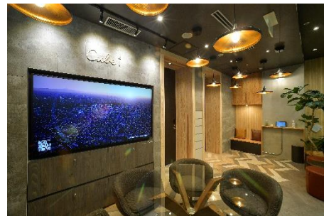
Cube i 有楽町 内観