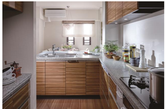
▲「ザ・パークハウス 碑文谷三丁目」モデルルーム写真 Kタイプ (94.31㎡)