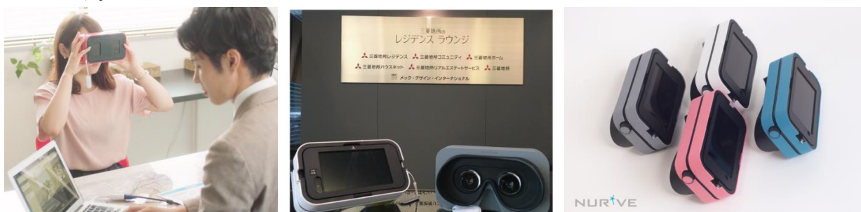
▲「VR内見システム」接客例とVR接客端末「CREWL(クルール)」

これまで三菱地所レジデンスの新築分譲マンション7物件(首都圏5件、関西圏2件)、三菱地所ホーム全てのホームギャラリーでVR素材活用の実績がありましたが、三菱地所ハウスネットでも取り扱っている売買仲介物件 *2 のVR内覧が可能となり、今後、賃貸・リフォーム物件など他の物件タイプや動画・インテリアパターン・眺望などVR素材のラインアップを拡げることも視野に、お客様への提案力を一層強化していきます。 *2 三菱地所レジデンスのリノベーション物件等を含み、お客様のご承諾を得た物件