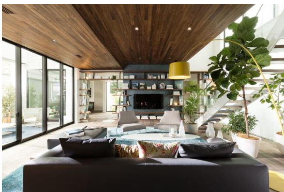
▲駒沢ステージ2 ホームギャラリー